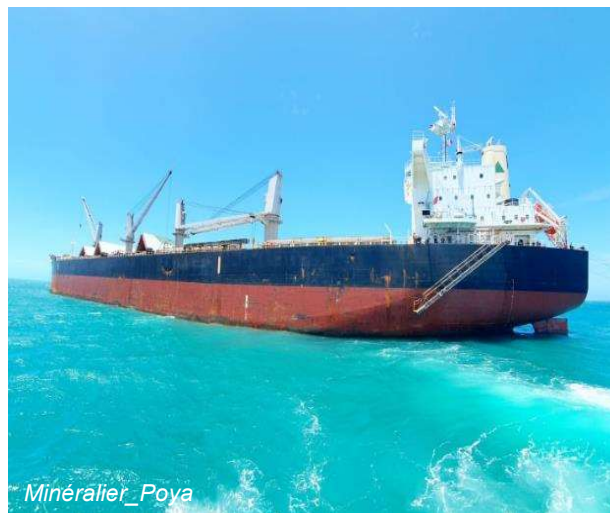
Minéralier _ Poya