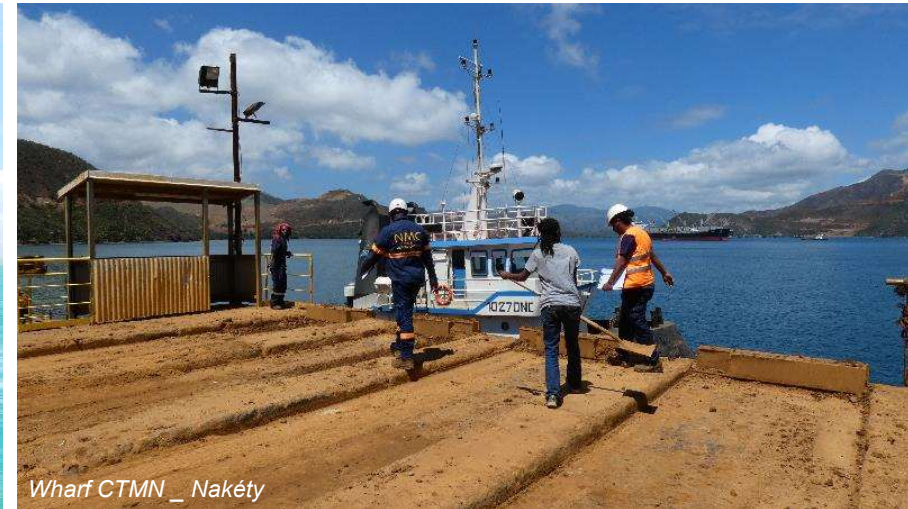
Wharf CTMN _ Nakéty