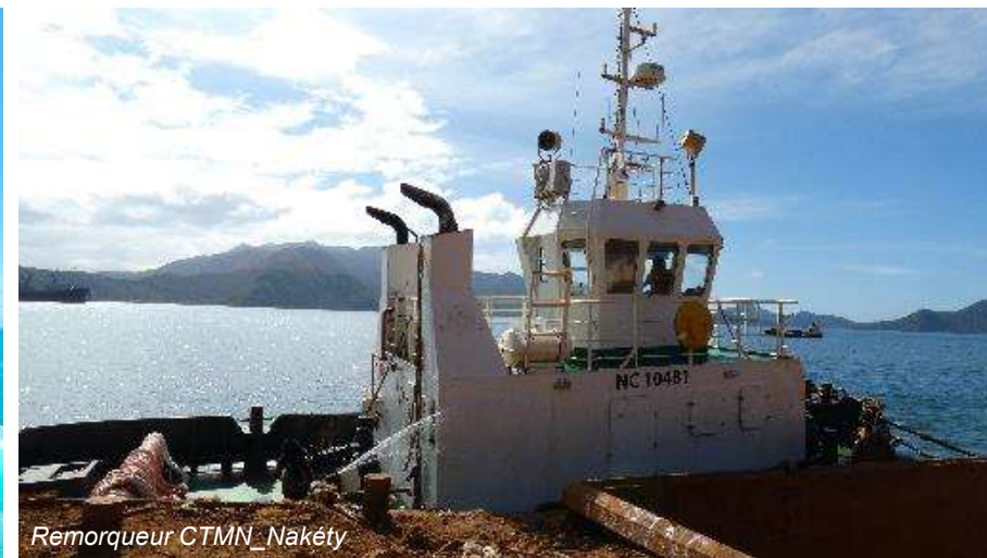
Remorqueur CTMN _ Nakéty