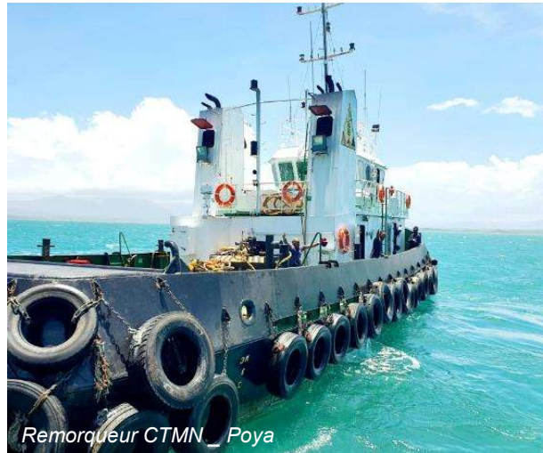
Remorqueur CTMN _ Poya